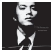
Dance of the Baroness PVCJ-1001 ¥2,100(税込) デビューリサイタルライブ録音

●僕のショパン 名曲集&ドラマ CD シリーズ 発売元：バップ 各¥2,500(税込)