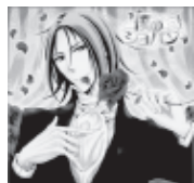
#2 リスト 2010.8.25 発売 VPCD-81666