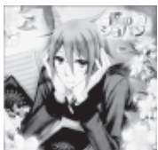
#3 シューマン 2010.10.27 発売 VPCD-81667