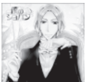
#4 メンデルスゾーン 2010.12.22 発売 VPCD-81668