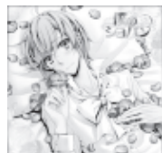
#1 ショパン 2010.5.26 発売 VPCD-81665

●僕のショパン 名曲集&ドラマ CD シリーズ 発売元：バップ 各¥2,500(税込)